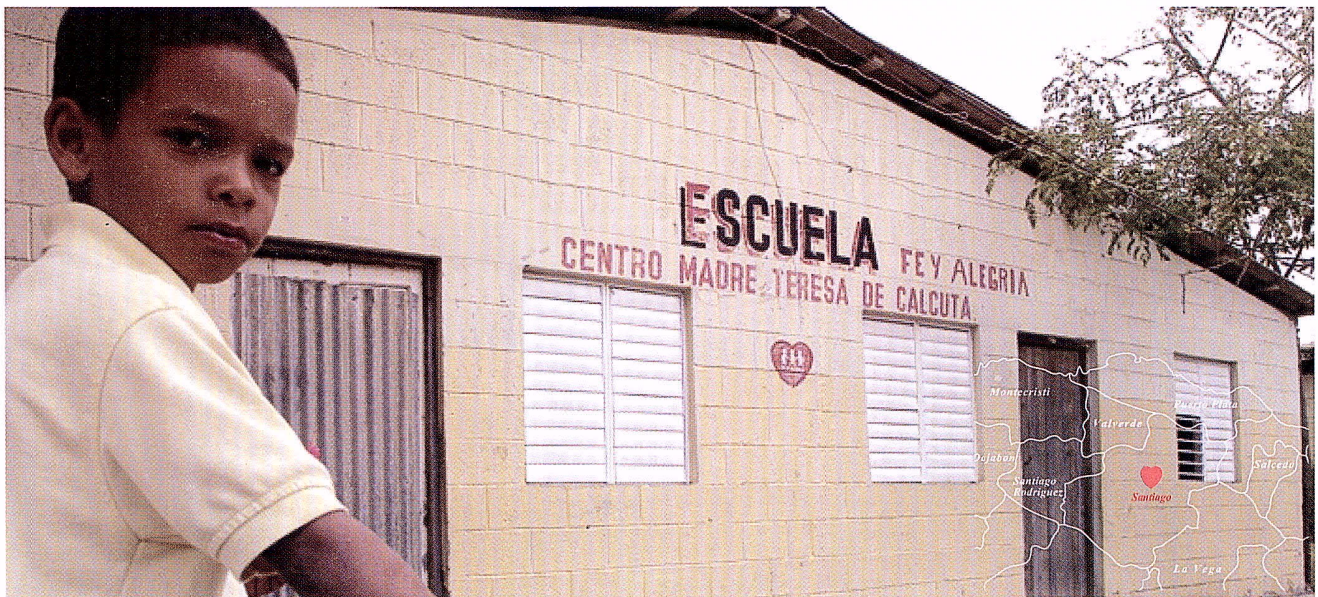
CENTRO MADRE TERESA DE CALCUTA.